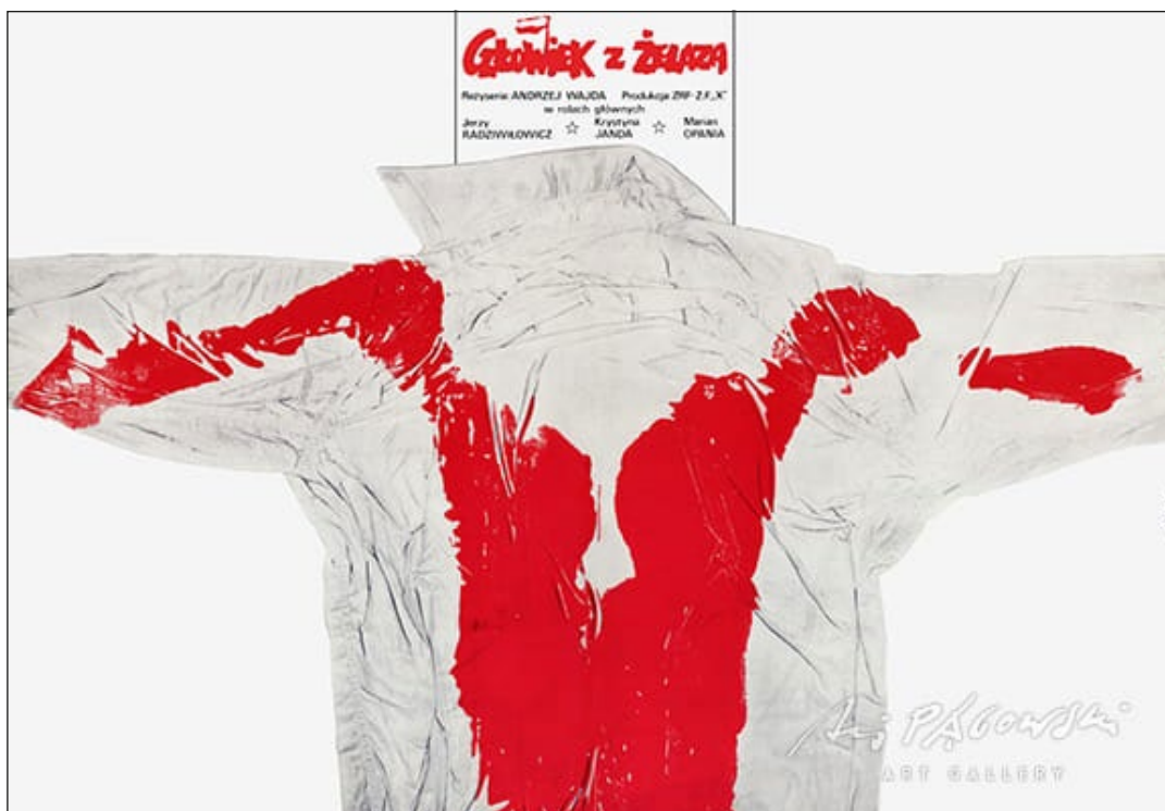
↓ Człowiek z Żelaza, plakat filmowy, autor: Andrzej Pągowski, źródło: pagowski.pl